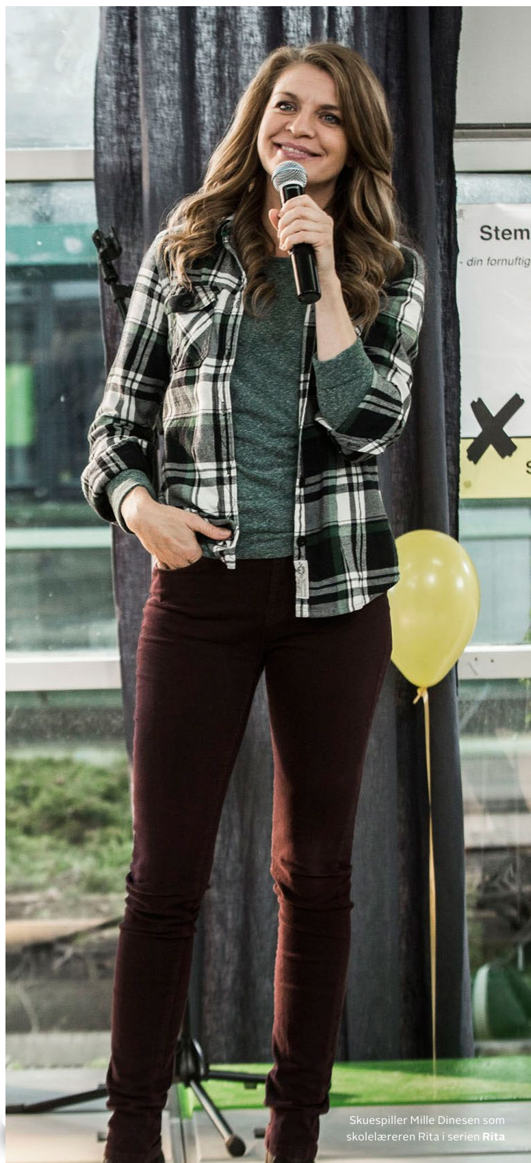
Skuespiller Mille Dinesen som skolelæreren Rita i serien Rita