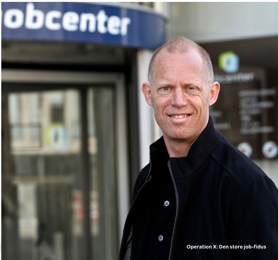
Operation X: Den store job-fidus