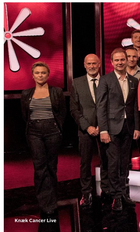
Knæk Cancer Live

denne politik, at TV 2s redaktører og chefer får henvendelserne i uredigeret form uden mellemliggende bearbejdnings.