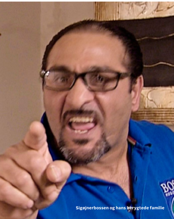
Sigøjnerbossen og hans berygtede familie