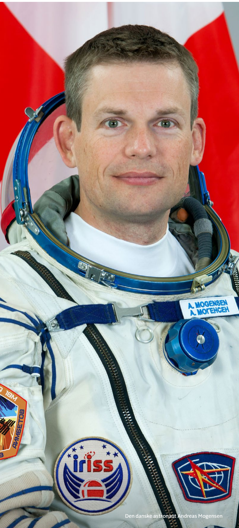
Den danske astronaut Andreas Mogensen

Herudover understreges det, at minimum to nyhedsudsendelser hver aften på hverdage samt direkte folketingsvalg-programmer og nationale begivenheder tekstes.