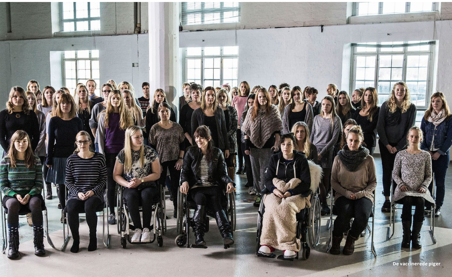
De vaccinerede piger